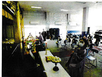
花まつりの法要でガウンを着ます。