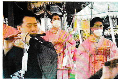
正面右側桃色の衣が住職

この行事は令和2年より新たな形で開催する予定でしたが、新型コロナウイルス感染症の影響により、これまで中止になっていました。今年ようやく新しい形での納骨永代経法要として行うことができたものです。覚法寺の住職も参列しております。