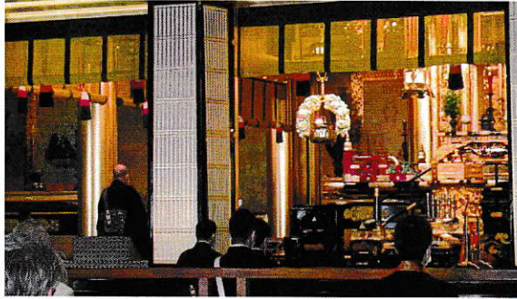
前門様ご出座のもと、阿弥陀堂で勤行の様子

本願寺では平成29年より、国宝である阿弥陀堂内陣や唐門などを修復してまいりました。この度その両方の修復が完了いたしました。4月には「阿弥陀堂内陣修復完成慶讃法要」が執り行われたところでした。その少し前に完成いたしました唐門と合わせて、両方とも拝観や参拝ができるようになりました。