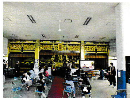
パソコンを使ってSDGsについて学びました。