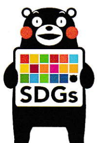
©2010 熊本県くまモン 熊本県 SDGs 登録事業者