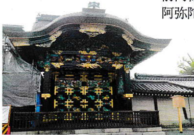
綺麗な彩色で復元された唐門