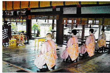
写真の一番右側が住職